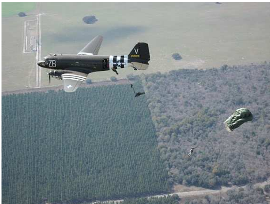
Unser LFZ C-47 Dakota "Tico Bell" in 2. WK Farben

Ausbildung: Auf Rundkappenschirm Systeme per automatischer Öffnung Absetzplatz: Flugplatz Dunnellon in Florida / USA Fallschirm: US Militärfallschirme SF-10A oder MC1-1C (Springer entscheidet), Freifaller eigenes System Absetz LFZ: Anfänger: C-180 und C-47 Dakota/ Skyvan, falls die Dakota ausfällt Erfahrenene Springer und Freifaller nur C-47 Dakota Absetzhöhe: Automaten zwischen 500 und 900m